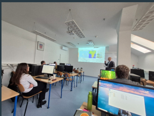
Slika 17 Detalj s GIS radionice održane na Geografskom odsjeku PMF-a u Zagrebu