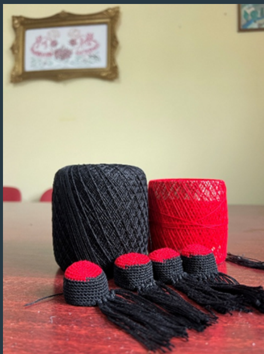
Slike 10 i 11 Fotografije s terenskog istraživanja doktorandice Eme Bašić