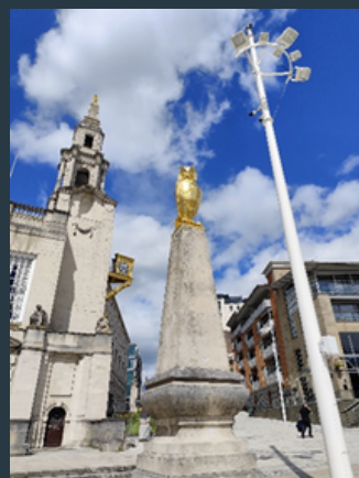
Slika 2 Detalj s glavnoga trga u Leedsu, Engleska.