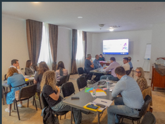
Slika 12 Sudionici The Mountainous Region Regeneration Canvas radionice

Dana 12. rujna 2024. godine u Gospiću je održana radionica u kojoj je objedinjen rad COST MARGISTAR akcije i RURALIKA projekta. Radionica je pripremljena od strane stručnjaka na COST MARGISTAR akciji, sudionici radionice bili su stručnjaci iz raznih društvenih i gospodarskih područja grada Gospića, a tema radionice glasila je „The Mountainous Region Regeneration Canvas (MRRC) – Platno za regeneraciju planinske regije“.