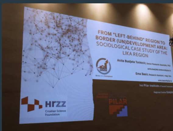
Slika 15 Detalj sa izlaganja sa istraživačkoga posjeta i radionice u Grazu

Dana 12. i 13. prosinca 2024. godine članice projektnoga tima Anita Bušljeta Tonković i Ema Bašić sudjelovale su u istraživačkom posjetu i radionici na Sveučilištu u Grazu u Austriji (Odjel Southeast European History and Anthropology). Na taj su način, predstavljajući rad na projektu RURALIKA kroz temu izlaganja „Od (iz)ostavljene ruralne regije do graničnog (ne)razvijenog područja: sociološka studija slučaja regije Lika / From left-behind rural region to border (un)development area: Sociological case study of the Lika region“ učinile poveznicu s projektom BAD – Pogranični razvoj na prostoru između Une i Jadrana: od habsburške Vojne krajine do schengenskoga ruba EU-a, koji se izvodi u Institutu društvenih znanosti Ivo Pilar (NextGeneration EU).