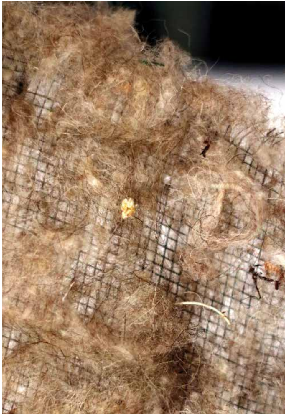
FRA DIDAKOV SAN, 2022. aluminijska mreža, ovčja vuna, osušeni cvjetovi lavande, kadulje, smilja, masline, lovora i bršljana slova ispletena od niti sirove vune, 70 x 50 x 3,5 cm