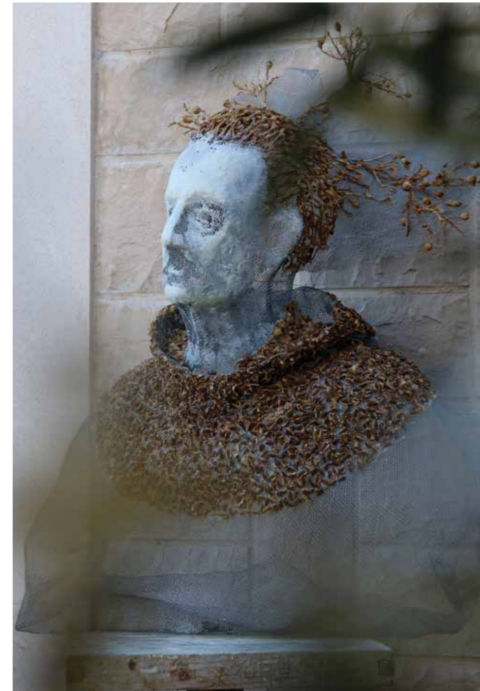
DONUM, 2021. Pocinčana mreža, osušeni dijelovi cvjetova hercegovačke biljke duhan ubrane u Hercegovini (latice, prašnici, plod, stapka sa plodom, sjeme) parafinski i pčelinji vosak, 85 x 67 x 72 cm