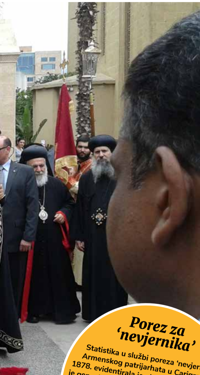
Obred posvete ulja u Libanonu 2015. godine