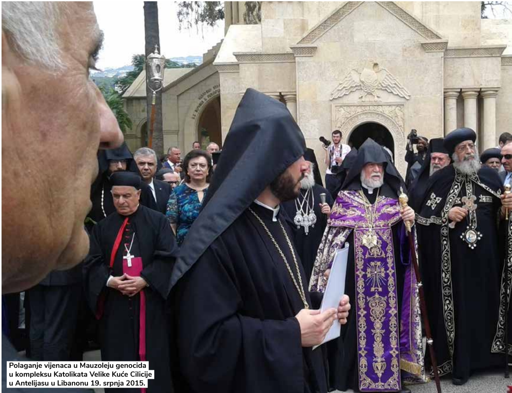
Polaganje vijenaca u Mauzoleju genocida u kompleksu Katolikata Velike Kuće Cilicije u Antelijasu u Libanonu 19. srpnja 2015.

Stoga je zanimljivo pratiti fenomen prešućivanja tiskanih medija u hrvatskim zemljama tijekom armenskog genocida. Austro-Ugarska Monarhija kao zemlja saveznica podržavala je osmansku vlast, iako je, kao zaštitnik rimokatolika, bila upoznata s teškim stanjem kršćana. Državna cenzura tiska u Monarhiji bila je u ratnim godinama od 1914. do 1918. tolika da lokalne novine nisu objavljivale vijesti o apokaliptičnom stanju u Maloj Aziji. Iako je Dubrovnik očuvao brojne veze s Levantom, kao i brojne obiteljske veze svojih iseljenika, gradske novine Prava Crvena Hrvatska, koje su 1915. tjedno pratile politička događanja u Osmanskom Carstvu, ipak su kao novine savezničke države glorificirale tursku vojnu snagu i moć, bez ikakvih vijesti o brojnim armenskim žrtvama iako je genocid već započeo tijekom travnja. Austro-Ugarska je u ratnom tisku filtrirala vijesti, dok je brojna hrvatska zajednica u Carigradu i Smirni itekako bila upoznata s tijekom događanja. U Vilajetu Aydin, u čijem