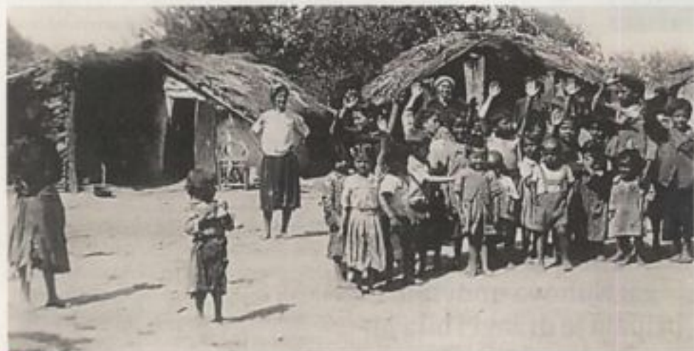
■ SRPSKA I ŽIDOVSKA ZAJEDNICA IMALE SU INTELIGENCIJU DOK ONA ROMSKA U HRVATSKOJ GOTOVO DA NIJE POSTOJALA, PA SE NIJE PISALO NI ISTRAŽIVALO OVU TEMU, NITI SE RAZVILA KULTURA SJEĆANJA