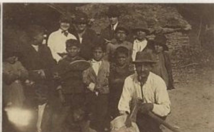
FOTOGRAFIJE ROMA IZ ROMSKOG NASELJA ŽLEBICE PRIJE DRUGOG SVIJETSKOG RATA