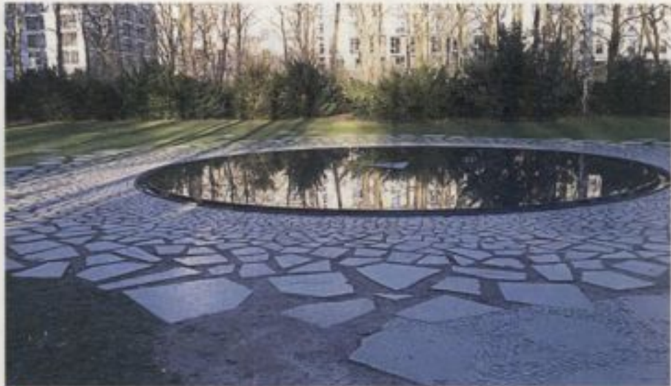
■ NJEMAČKI KANCELAR HELMUT SCHMIDT TEK 1982. SLUŽBENO JE PRIZNAO DA JE NJEMAČKA IZVRŠILA GENOCID NAD ROMIMA I SINTIMA PA SU ONI TRAZILI ODŠTETU I TO JE DOBILLO POZITIVNI EPILOG IZGRADNJOM SPOMENIKA U BERLINU

“Sudilo im se 1942. u Osijeku, ali ne znam rezultat te presude. Karakteristično je za razdoblje uoči Drugog svjetskog rata da je bilo više nasilja nad Romima nego nad bilo kojom drugom skupinom uključujući i Židove, unatoč antižidovskim zakonima donesenim 1940. u Banovini Hrvatskoj. Rome se progonilo iz inercije anticiganizma i stereotipa. Imate slučaj da se romsko stanovništvo u mjestu Okić lugu nasilno iselilo s područja koje su oni legalno kupili agrarnom reformom nakon Prvog svjetskog rata. Vješalo ih se, palili su im se tabani i slično. Iako takvi slučajevi nisu bili rijetkost,