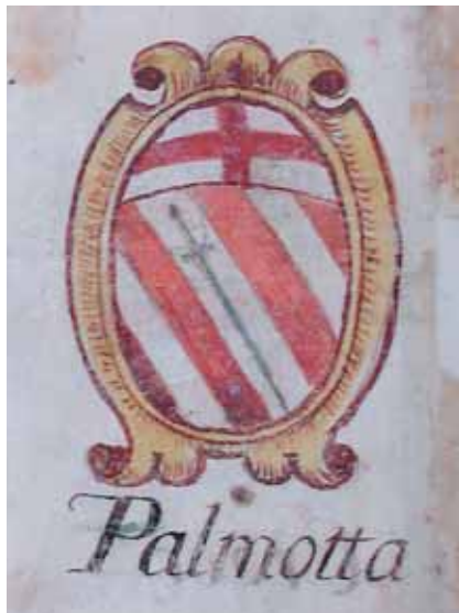
Slika 3. DAD, Grb plemićkog roda Palmotića iz Pešićeva (Sarakina) grbovnika

Vinicije B. LUPIS Prilog poznavanju roda Palmotića i životopis Jakete Palmotića Dionorića (? – 1680.)