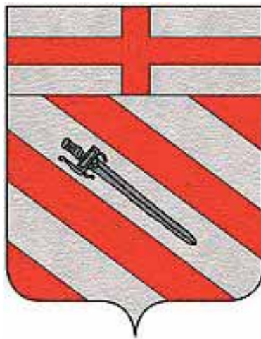
Slika 2. Grb plemićkog roda Palmotića

U ključnom političkom trenutku 1358. kada se dubrovačka komuna emancipira u trgovačku republiku, nitko od Palmotića nije u Senatu. 6 U odlukama dubrovačkih vijeća od 1390. do 1392. spominju se dva člana obitelji Palmotić. Pa se tako Petar Palmotić spominje na više časti, među kojima treba istaknuti: član Malog vijeća, providnik