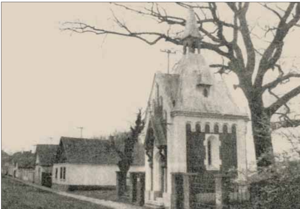
Slika 2. Kapela u suburbanom ambijentu Prijeva (prema: ***1992., 162)