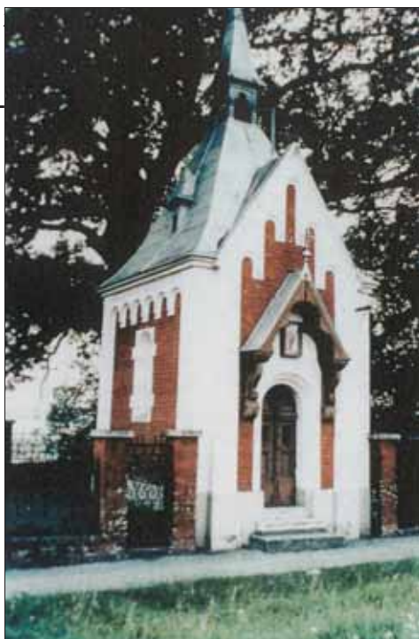
Slika 5. Kapela prije razaranja, stanje oko 1990. (prema: Kosec i sur., 1997., 28)