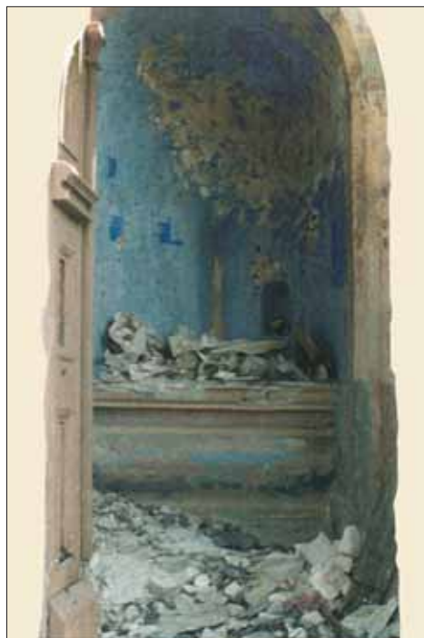
Slika 8. Uništen interijer i umjetnine u kapeli, stanje 1997.