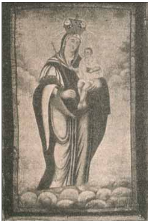
Slika 7. Čudotvorna slika Gospe od hrasta (prema: Belavić, 1928., 43)