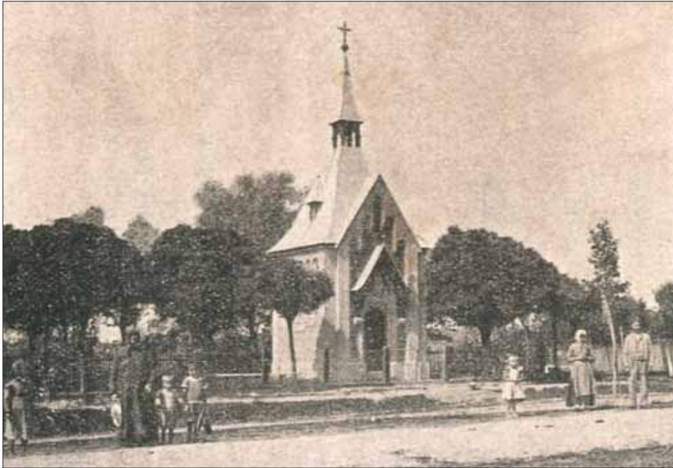
Slika 1. Kapela nakon izgradnje - fotografija iz 1918. (prema: Belavić, 1928., 49)