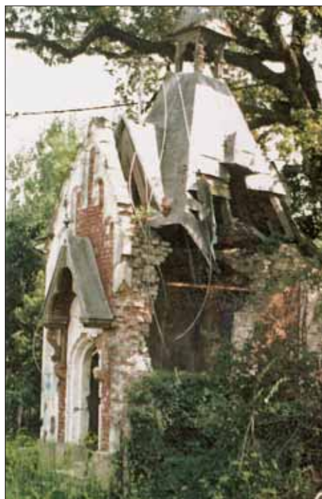
Slika 6. Kapela nakon razaranja, stanje 1997.