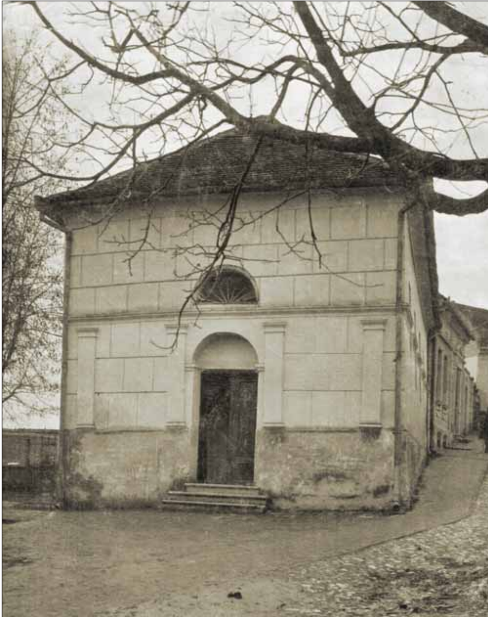
Slika 1. Prva vukovarska sinagoga, kasnije adaptirana u kalvinsku crkvu, Gradski muzej Vukovar