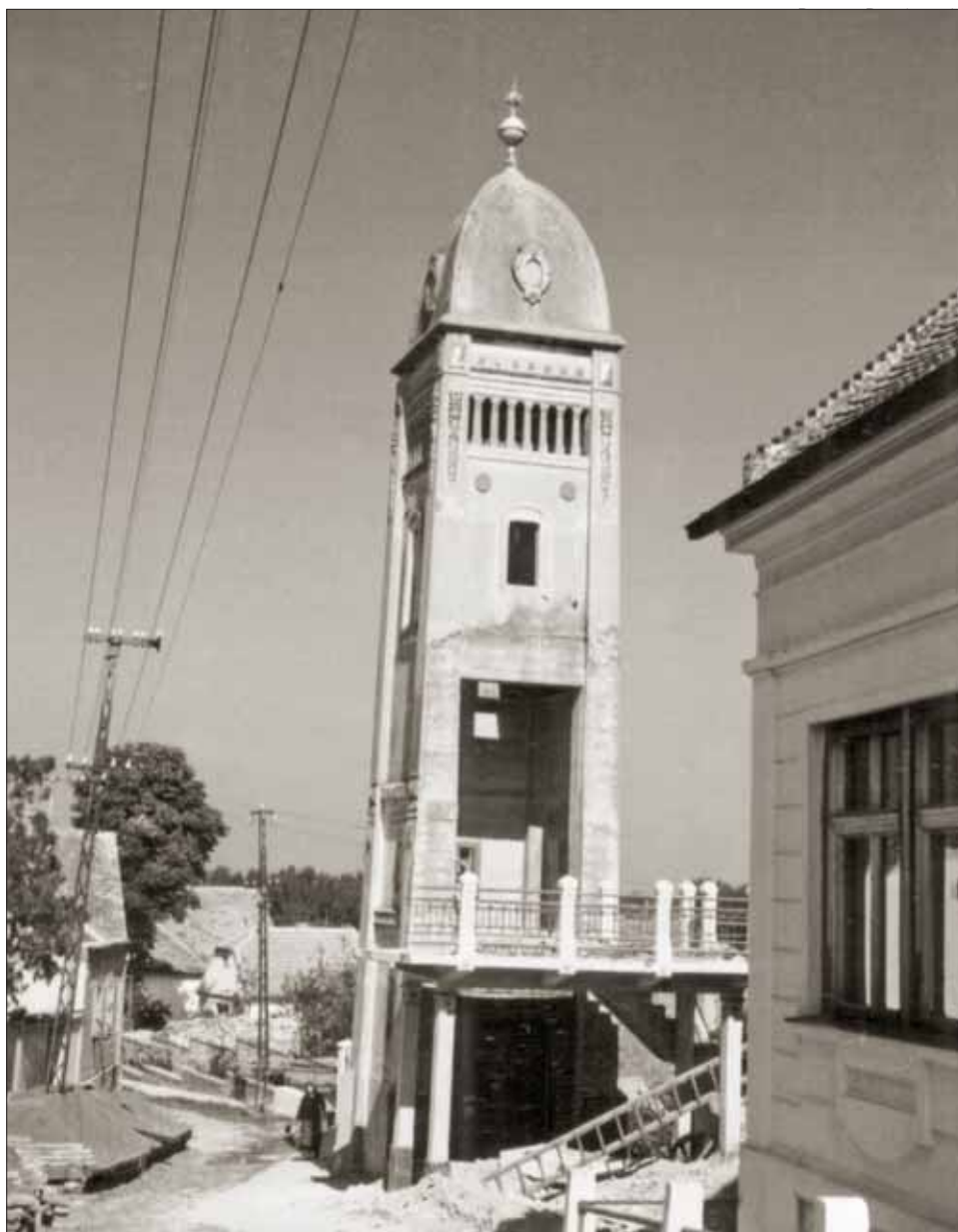
Slika 5. Rušenje kalvinske crkve, Gradski muzej Vukovar