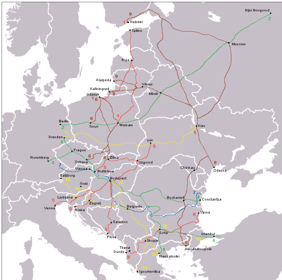
Slika.1 Paneuropski prometni koridori u postkomunikacijskim zemljama