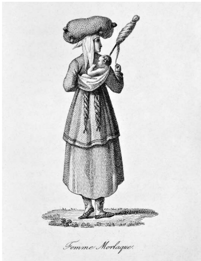
Slika 1. Morlakinja kao arhetipski patrijarhalni model ženske radišnosti (Hacquet, B., L'Illyrie et la Dalmatie , 1815., između 14. i 15. str.)

– nevjesta i vještica. 12 Vještica je žena koja je vješta, koja zna , ona kojoj se čak u nazivu pridaje vrijednost, sposobnost, znanje (obično umijeće liječenja travama, ispravljanje kostiju itd.). Prema tumačenju dvaju dalmatinskih autora 18. stoljeća, Ivana Lovrića (1776.) i Pietra Nutrizia Grisogona (1780.), vješticama postaju žene koje su ljutite što se nisu udale pa kad uđu u neke godine, pretvaraju se da su opsjednute, pridobivajući važnost svojim znanjima, pa makar bila i vještičja.