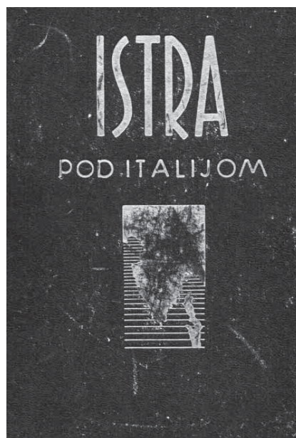
Naslovnica knjige Ernesta Radetića Istra pod Italijom, koja je potkraj godine 1944. objavljena u Zagrebu.

sadržaja. 31 Ipak treba upozoriti da je autor u predgovoru (datiranom s 16. rujna 1944.) imao potrebu istaknuti da «smo svjedoci strašne Kalvarije, koju je posljednjih 25 godina prošao, a i još uvijek prolazi onaj naš dobri narod», što je hrvatsku javnost još jednom opomenulo na činjenicu da je Istra i dalje bila izvan hrvatskih granica.