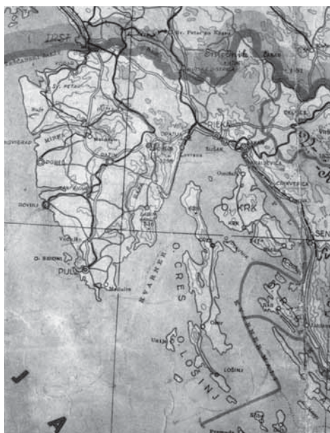
Zamišljeni prostor Velike župe Raša prikazan je i na zemljovidu Nezavisne Države Hrvatske, koji je godine 1945. objavio Zemljopisni zavod oružanih snaga.

vid objavljen na najvišoj vrjednoti niza poštanskih maraka posvećenih I. hrvatskoj udarnoj diviziji, koje su stavljene u promet početkom siječnja 1945. godine. 33 Svakako najzanimljivija publikacija iz 1945. godine (čije je prvo izdanje po svoj prilici objavljeno još 1944. godine) je spomenuti samostalni zemljovid, kojeg je tiskao Zemljopisni zavod Oružanih snaga. 34 On je jasno pokazao da je sjevernom granicom NDH na istarskom području trebala biti nekadašnja granica Markgrofovije Istre. Isti je pokazao i to da je zamišljena Velika župa Raša trebala zauzeti područje koje se protezalo zapadno od granice uspostavljene Rimskim ugovorima od 18. svibnja 1941. O tome kakvo je bilo pravo stanje stvari svjedoči donekle i sam zemljovid. Naime, područje Velike župe Raša nije podijeljeno na kotareve, a nije određeno niti njezino sjedište. To pokazuje da vlasti NDH (odnosno ministar unutarnjih poslova) nisu imale potrebu urediti to područje čak ni na papiru, budući da nad njim nisu imale nikakav nadzor.