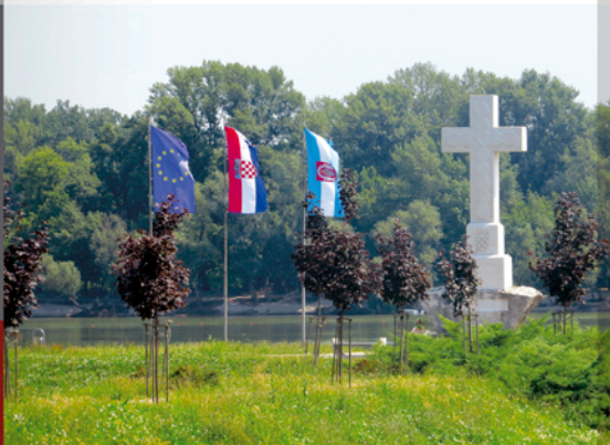
Fotografija na naslovnici: Kriz za slobodu Hrvatske (Similar: Miroslav Žarić)

Uredili D. Živić, S. Špoljar Vržina, S. Cvikić, I. Žebec Šilj