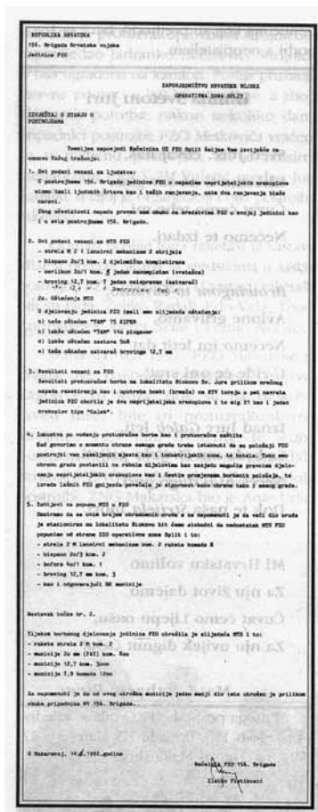
Slika 1. Izvjeshće načelnika PZO 156. br. HV-a

„U Konavoskim brdima“ – prilog poznavanju ratnog puta 156. makarsko- vrgo- račke brigade/domobran- ske pukovnije HV-a