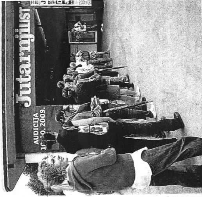
U akciju 'Moja Hrvatska' uključite se se već stotine ljudi.

Stručnjaci tvrde da kriza nije samo nevolja već i prilika za promjene. To pogotovo vrijedi za nas: krizu smo gradili proteklih 20 godina, stvarajući državu sa strukturnom pogreškom, u kojoj se mito i veze isplate više od rada i učenja. Recite "Dostaj" i uključite se u akciju "Moja Hrvatska". • JL