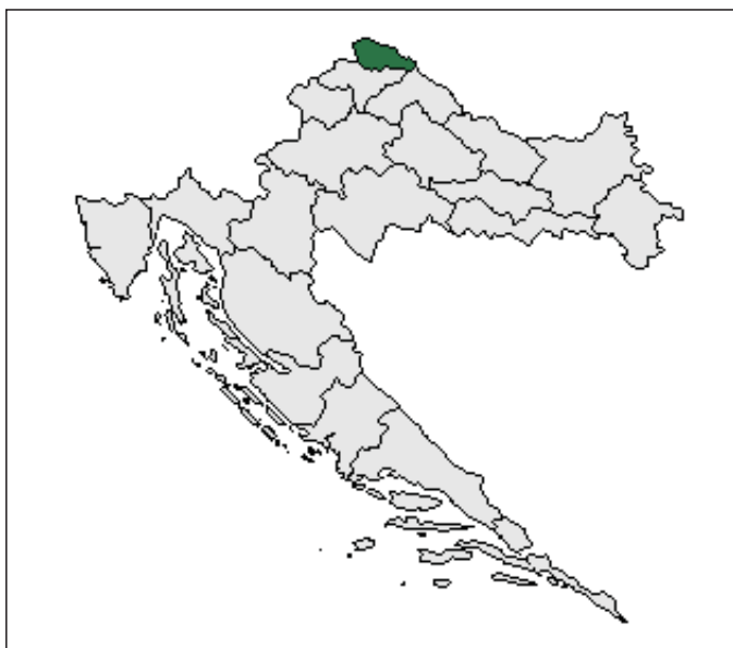
Slika 1. Položaj Međimurske županije na administrativnoj i zemljopisnoj mapi Hrvatske

snim i kulturnim značajkama, Međimurje predstavlja zasebnu cjelinu. Reljefno se dijeli na bregovito Gornje Međimurje na sjeverozapadu (gdje završavaju krajnji istočni obronci Alpa, ne viši od 350 metara nadmorske visine) i nizinsko Dolnje Međimurje na jugoistoku (otvoreno prema Panonskoj nizini). Slika 1. pokazuje da je Međimurje najsjevernija administrativna jedinica u okviru županijskog ustroja Hrvatske, definiranoga početkom devedesetih godina prošloga stoljeća.