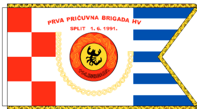
Slika 6. Primjer zastave tipa IV: zastava 114. brigade HV, Split, 1992.

Kao jasan podtip tog tipa zastava ističu se zastave “kantonskog trokuta” 3 – najčešće trobojnice koje uz koplje imaju dodan velik jednobojni pravokutni trokut čije katete leže uz kopljeni i gornji rub zastave, u kojem se nalazi znak postrojbe (Slika 7). Dizajn zastave s kantonskim trokutom jedno je od osobito uspješnih dizajnerskih rješenja u skladu sa svim pozitivnim smjericama veksilološke teorije, a ističe se jedinstvenošću oblika koji je nepoznat među drugim zastavama. Može se reći da je šteta da se takav tip zastava nije održao, odnosno da u određenom trenutku u OS RH nije postojao nitko tko bi prepoznao i sačuvao, odnosno proširio takvo rješenje kao izvorni hrvatski identitetski obrazac.