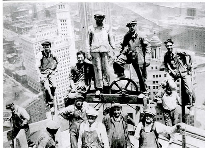
PRILOG 3: Skupina iseljenika na izgradnji jednoga od mnogih američkih nebodera

Općenito gledajući, manjak detaljnijih analiza glede pretpostavki i uvjeta procesa akulturacije i asimilacije ima - unatoč sve većem broju istraživanja - za posljedicu da je još uvijek nejasno što se točno događalo i što se događa u crnoj kutiji tzv. melting pot situacije. S tog motrišta, ova knjiga predstavlja, kako je to prikazano u završnom poglavlju, i malu pohranu konkretnog empirijskog doprinosa činjenično točnijoj određenosti tog - u smislu procesa akulturacije i asimilacije - naglašeno kontradiktornog pojma.