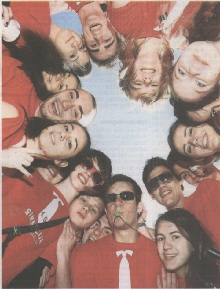
Myplace je ispitivao građansko, političko i društveno sudjelovanje mladih

Naši mladi, nakon Grka, imaju najmanje povjerenja u političke institucije te jako negativan stav prema političarima i stanju u društvu. Među najvažnija tri događaja u hrvatskoj povijesti za 93% njih je Domovinski rat, potpisivanje ugovora o pristupanju EU važno je za 76%, dok je 70% mladih razdoblje NDH ocijenilo važnim događajem. No, to ne znači da mladi veličaju NDH, kako su krivo interpretirali neki mediji. – Nije bilo pitanje što misle o NDH, nego da procijene važnost tog razdoblja. Ako netko smatra da je NDH