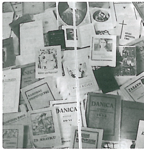
Neka od izdanja Društva sv. Mohora za Istru.

Mislim da se nikad svećenički poziv ne iscrpljuje njegovim djelovanjem, kako vi kažete, za oltarom. Doduše, od pojave gra- đanskoga liberalnog društva u 19. stoljeću preko totalitarizama 20. stoljeća do suvre- mene diktature relativizma, uvijek su pri- sutna nastojanja da se svećenike i Crkvu