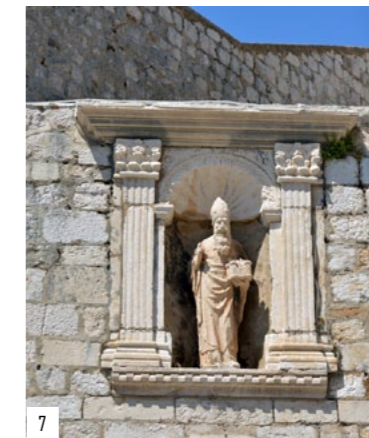
5. Статуя Св. Влахо. Дубровник 6. Дубровник 7. Статуя Св. Влахо. Дубровник

— Хорваты в Дубровнике знают об Армении, о геноциде армян, что армяне — это первый христианский народ. Точно также каждый хорват, осуществивший паломничество на Святую Землю, знает об армянах в Вифлееме и храме Гроба Господня. В Вифлееме сохранилась древняя резная дверь у входа в базилику Рождества Христова, которая была изготовлена в 1227 году по повелению армянского царя Хетума I из династии Рубенидов. В Храме Гроба Господня в Иерусалиме в определенной последовательности армянские, католические и греческие священники совершают литургию. Безусловно, хорваты знают и о Ноевом ковчеге на горе Арарат.