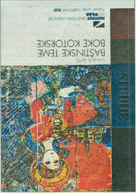
Vinčić B. Lupis: Baštinske teme Boke kotorske, Institut društvenih znanosti Ivo Pilar – Područni centar Dubrovnik i Gospad od Skrpjela, Dubrovnik – Zagreb, 2013.

Pisac ovih redaka slaže se s ocjenama recenzenata. Lupisova je knjiga na određeni način ne samo znanstvena i stručna valort-znaja kulturne baštine Hrvata u Boki kotorskoj, već je ova knjiga i dokaz kulturnog jedinstva hrvatskoga naroda bez obzira unutar držine granica bio prinuđen živjeti. Ona je kritika protiv zaborava, protiv prešućenog prihvatanja zabacivanja hrvatskog predznaka kulturnoj baštini Hrvata u Boki. Ona ima