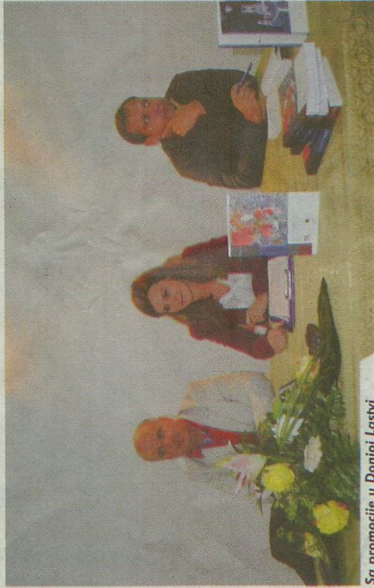
Sa promocije u Donjoj Lastvi