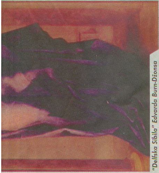
"Delfska Sibila" Edvarda Burn-Džonsa