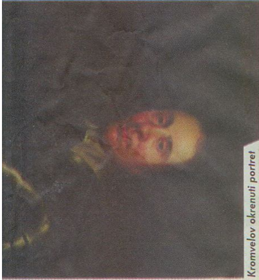
Kromvelov okrenuti portret