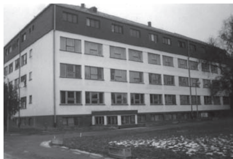
Slika 6. Obnovljena pročelja vukovarske bolnice