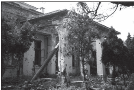
Slika 7. „Vila Knoll“ nakon razaranja u ratu