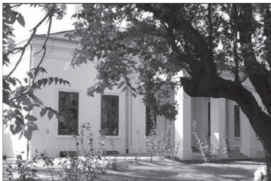
Slika 8. Obnovljena „Vila Knoll“ (zgrada Uprave vukovarske bolnice)