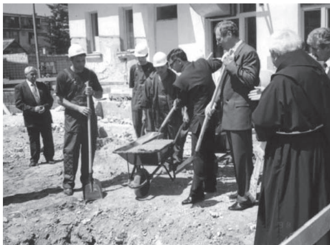
Slika 4. Početak obnove vukovarske bolnice

Vesna Bosanac Binazija Kolesar Uloga zdravstvenog sustava u mirnoj reintegraciji Hrvatskoga Podunavlja