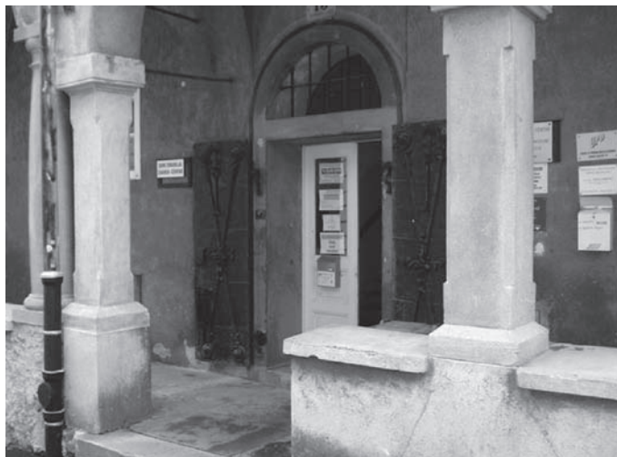
Slika 1. Ispostava HZZO-a kod Kamenitih vrata, Zagreb

Nakon potpisanog Sporazuma o mirnoj reintegraciji Hrvatskoga Podunavlja 1996. godine, počelo je raditi i Povjerenstvo za reintegraciju zdravstvenog sustava u redoviti zdravstveni sustav Republike Hrvatske. U to vrijeme u okupiranom dijelu Hrvatskoga Podunavlja djelovale su dvije zdravstvene ustanove: Zdravstveni centar „Sveti Sava“ Vukovar i Dom zdravlja „Beli Manastir“.