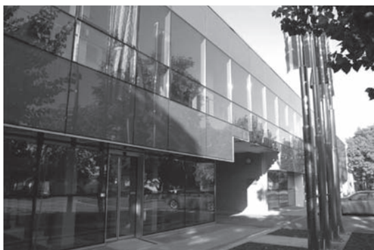
Slika 9. Novoizgrađena poliklinika vukovarske bolnice