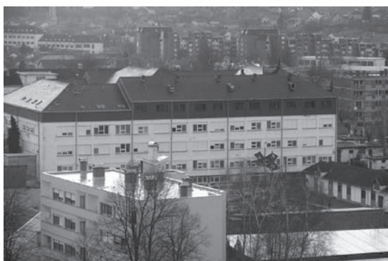
Slika 10. Obnovljena vukovarska bolnica