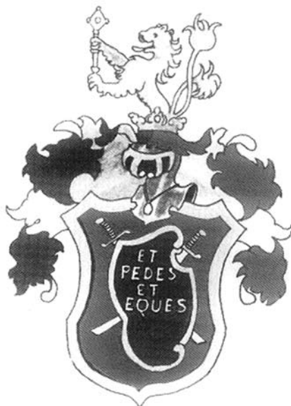
Sl. 5. Obiteljski grb Vučetić

posredne blizine habsburških careva i nadvojvoda, jer su uporno i marljivo izvršavali vojničke dužnosti.