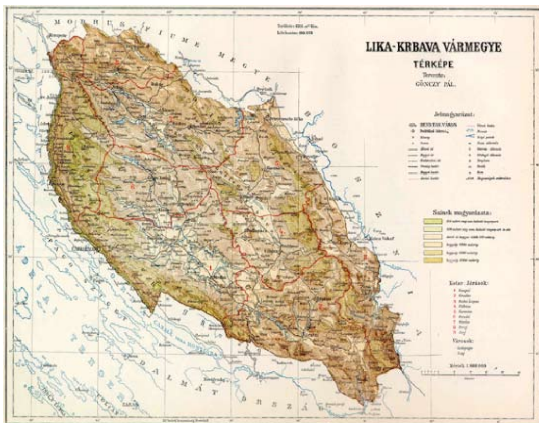
Sl. 1. Karta Ličko-krbavske županije

Ličko-krbavska županija s površinom od 6211,16 km 2 bila je treća županija po veličini u Hrvatskoj i Slavoniji na prijelazu iz 19. u 20. stoljeće. Isprva se sastojala od sedam upravnih kotara: Gospić, Gračac, Korenica, Otočac, Perušić, Senj i Udbina. U sastavu kotara Gospić bilo je pet općina (Gospić, Karlobag, Lički Osik, Medak i Smiljan), u sastavu kotara Gračac pet općina (Bruvno, Gračac, Lovinac, Srb i Zrmanja), u sastavu kotara Korenica četiri općine (Bunić, Korenica, Ličko Petrovo Selo i Zavalje), u sastavu kotara Otočac šest općina (Brlog, Dabar, Otočac, Sinac, Škare i Vrhovine), u sastavu kotara Perušić tri općine (Kosinj, Pazarište i Perušić), u sastavu kotara Senj pet općina (Brinje, Jablanac, Jezerane, Krivi Put i Sveti Juraj) i u sastavu kotara Udbina