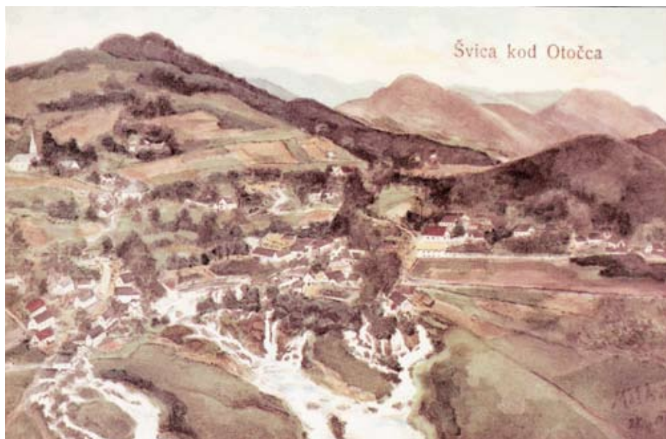
Sl. 4. Slapovi Gacke u Švici 1908. godine

Na području županije 1905. djelovalo je 12 čitaonica, pet pjevačkih i glazbenih društava, tri društva za podupiranje siromašnih učenika (u Gospiću je postojalo Društvo za potporu siromašnih gimnazijalaca), dva društva za tjelovježbu, društvo pučkih učitelja, jedno potporno i opskrbno društvo te jedno društvo za razne sportove ( Statistički godišnjak kraljevina Hrvatske i Slavonije , sv. I (1905), 1913., 771-776). U Gospiću je 1898. utemeljena podružnica Hrvatskoga planinarskog društva "Visočica", a 1900. osnovan je teniski klub, prvi u Lici. Početkom 20. stoljeća otvorena je u Gospiću prva moderna lička građanska kavana "Velebit", a uoči Prvog svjetskog rata u gradić na Novčici stigao je i prvi automobil. U Perušiću je još 1886. osnovan Odbor za uređenje Samogradske špilje. Godine 1907. u Udbini je utemeljeno Društvo za poljepšanje mjesta. Međunacionalne razlike poticale su