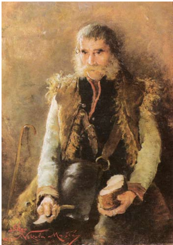
Sl. 2. Ličanin na slici Nikole Mašića

Ličko-krbavska županija je 1890. imala 190.978 stanovnika, 1900. godine 208.163, a prema popisu iz 1910., posljednjem popisu stanovništva u Austro-Ugarskoj, u njoj je živjelo 204.710 stanovnika. U skladu s porastom