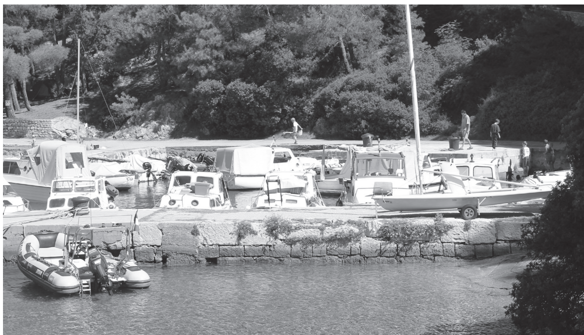
Slika 7 Ostaci mola u Bijaru

razvijanje, uz tradicionalno stočarstvo, i poljodjelstvo koje se temelji na uzgoju žitarica, maslina i loze. Time je stvorena osnova na kojoj će se, uz djelomičnu orijentaciju obalnih naselja na more, razvijati otočno gospodarstvo i u kasnijim vremenima.