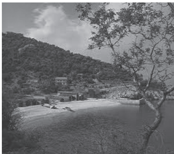
Slika 2 Luka Beloga, Podbeli

Za izgradnju luka na otočju koristile su se prirodno zaštićene uvale 8 kao što su to luka Belog ( Caput insulae ) u uvali Podbeli, luka gradine Svetog Bartolomeja u uvali