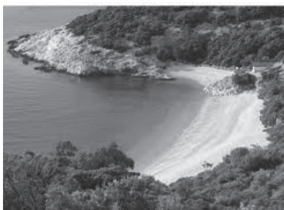
Slika 3 Luka podno Lubenica

Merag (današnja trajektna luka), duboki creski zaljev kao luka grada Cresa ( Crepsa , Crexa ), ostaci pristaništa podno antičkih naselja Polacine i Lovreški (ispod današnjeg sela Loznati) 9 , ostaci rimske vile i pristaništa podno gradinskog naselja Lubenica ( Hibernitia ), ostaci rimske vile i pristaništa na obali u Miholašćici, ostaci rimske vile i pristaništa na obali podno Ustrina, ostaci rimske vile na obali u Nerezinama (Mağazini, Bućanje), rimski ostaci na obali u Studenciću podno Sv. Jakova te ostaci rimske vile na obali u Studenciću kraj Čunskog 10 . Također su postojala i manja antička pristaništa na lošinjskim otočićima Unijama (Mirišće, Malanderski, Lokunji, Maračol) 11 , Susku (Donje Selo), Velim i Malim Srankanama, Iloviku te Sv. Petru.