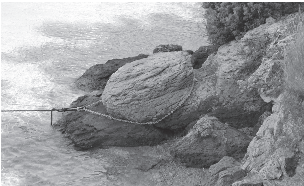
Slika 6 Bitva u Bijaru