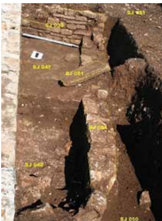
Sl.8. Vižula 2010, pogled na sondu

Ulomak tegule pod inventarnim brojem MV2010/92 pronađen je kao integralni dio SJ 032 (Sl. 2, 3, 10). SJ 032 je građevina od tegula međusobno povezanih žbukom i s unutarnje strane premazanih slojem žbuke. Dimenzije SJ 032 su 3,0 x 2,5 x 3,0 m, a širina zidova kreće se od 50 do 30 cm. Pronalazak tegule s pečatom radionice Kvinta Klodija Ambrozija svakako je terminus ante quem non .