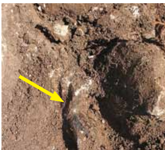
Sl.6. Vižula 2010, pogled na SJ 038