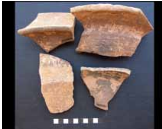
Sl.14. Vižula 2010, četiri ulomka keramičke zdjele

Četiri ulomka keramičke zdjele MV2010/89, 1-4 (sl. 14). Dimenzije MV2010/89,1: vis. 9,0 cm, šir. 15,7 cm, deb. stijenke 1,1 cm; MV2010/89,1: vis. 9,0 cm, šir. 15,7 cm, deb. stijenke 1,1 cm; MV2010/89,3: vis. 5,3 cm, duž. 11,7 cm, šir. 6,3 cm, deb. stijenke 1,0 cm; MV2010/89,4: vis. 2,3 cm, duž. 9,0 cm, šir. 9,2 cm, deb. stijenke 1,1 cm. Mjesto nalaza: SJ 050, sonda 1.