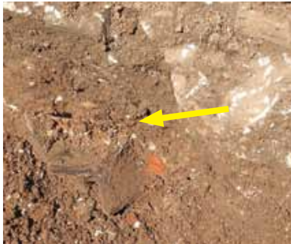
Sl.9. Vižula 2010, pogled na SJ 050 s detaljima ulomaka zdjele