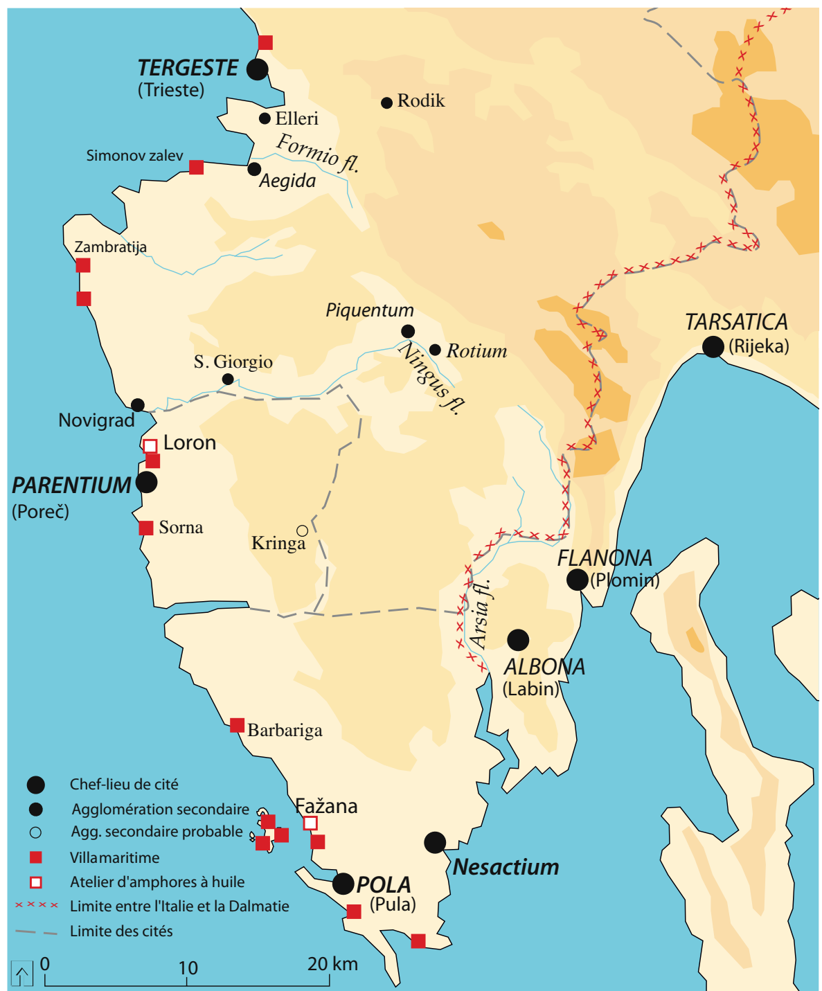
Figure 1 : L'Istrie au temps d'Auguste

Stignano, dans la périphérie nord de la ville ; on interprète traditionnellement ce lieu comme une fullonica , sans aucune preuve. 2