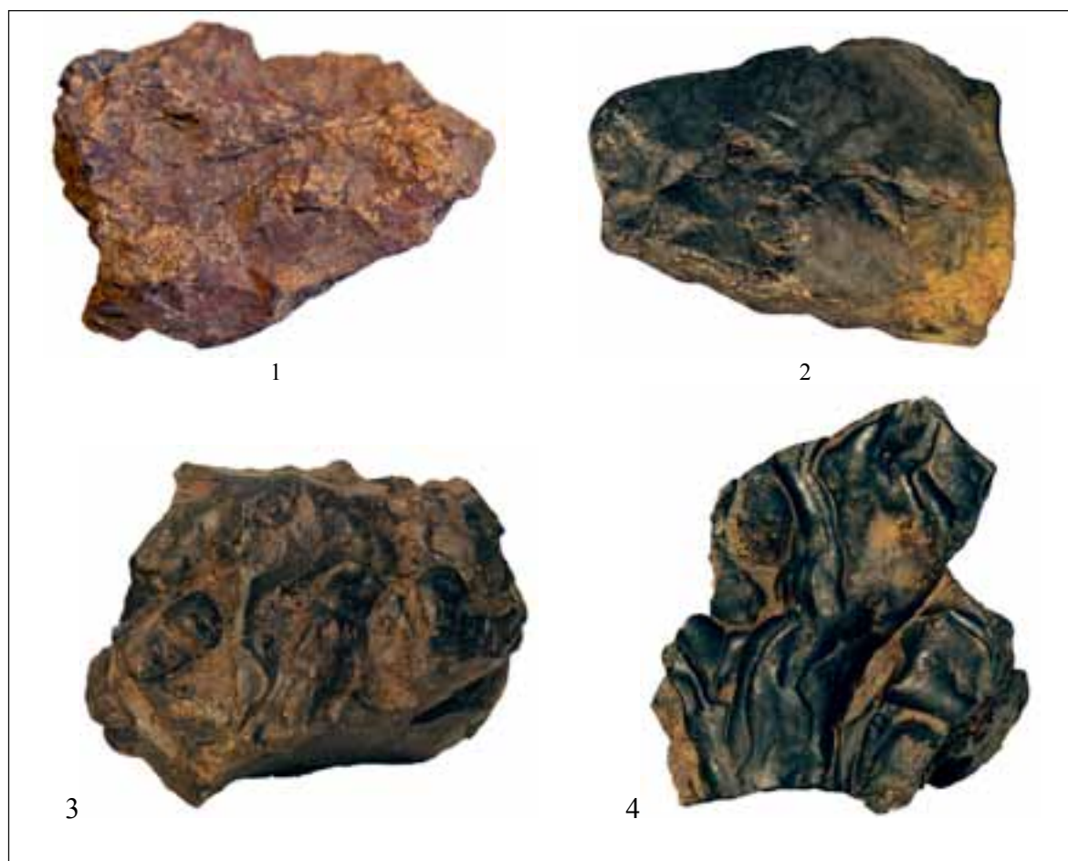
Sl.2. Primjeri uzoraka metalurške prerade rude željeza sa lokaliteta Čolaci. Amorfní komad željezne rude-uzorak 4 (1); uzorci primarne metalurške obrade-uzorak 5 (2); uzorak 2 (3); uzorak 6 (4).

istočne Bosne u Kreći kod Foče, na lokalitetu Gradina, gdje su zabilježeni metalurški nalazi u vidu peći sa nalazima troske, nastale topljenjem rude željeza – hematita, koji nedvojbeno ukazuju na postojanje ljevačke djelatnosti u naselju (Kosorić 1986, 26) što upućuje na postupak taljenja metalnih sirovina na području naselja i procesima primarne metalurgije lokalnog karaktera. 7 Peć sa ostacima željezne troske, tragovima gareži i topljenja metala, je pozicionirana na dojnjoj terasi naselja, gdje su metalurški procesi, prema evidentiranim nalazima, vršeni samo na ovom dijelu lokaliteta, što po svemu sudeći upućuje na postojanje lokalne metalurške radionice i talionice (Kosorić 1991, 6-22). Ovi nalazi o postojećoj metalurgiji na području istočne Bosne osim što govore u prilog o primarnim metalurškim procesima, proširuju sliku o načinu organizacije šireg regionalnog područja i kontaktima u procesu distribucije, razmjene i trgovine. Na koncu, svojim se značajem izdvajaju i metalurški nalazi sa gradine Čolaci koji ukazuju na postojanje primarne metalurške prerade metala u naselju, koji za sada predstavljaju, kronološki najranije dokaze o procesima primarne metalurgije željeza u okviru gradinskih naselja Bosne i Hercegovine.