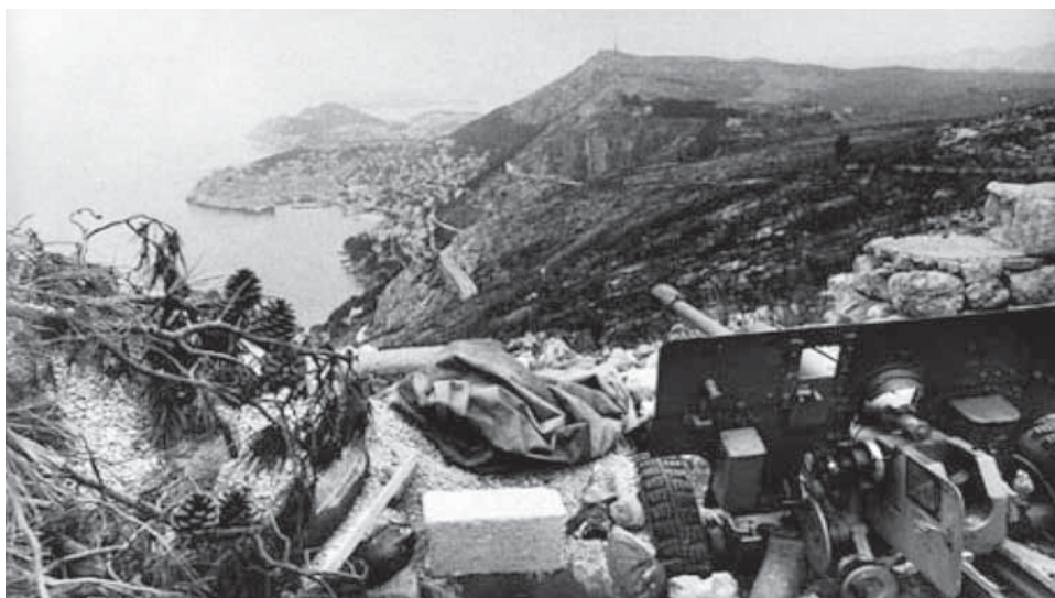
Slika 2. Pogled s Žarkovice s koje je gađan grad

od Porporele. Gađan je s brodova i tenkova u više navrata tijekom listopada, studenog i prosinca 1991. godine. U napadima su oštećeni mnogi spomenički objekti: u sjevernom dijelu otoka Lazaret i Fort Royal, na jugoistočnom dijelu otoka u Portoču, Kuća lugara, a u jugozapadnom dijelu Benediktinski samostan, Maksimilijanov ljetnikovac i kapela Navještenja. Izravnim pogocima uništeno je oko 20% svih biljnih vrsta u botaničkom vrtu na otoku, iako je cjelina otoka Lokruma zaštićena kao posebni rezervat šumske vegetacije. 4 Na otok su nakon obnove preselili Biološki institut HAZU, Prirodoslovni muzej i Memorijalni muzej Ruđera Boškovića.