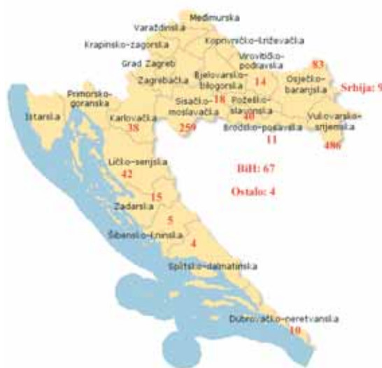
Slika 9. Nestale osobe u agresiji na Republiku Hrvatsku, po županijama, u BiH i Srbiji

Sociodemografska obilježja nestalih osoba, kao i ranije prikazani podaci o zatočenicima i identificiranim žrtvama, potvrđuju da je osnovna svrha agresije na Republiku Hrvatsku bilo etničko čišćenje. Naime, od 1.105 osoba nestalih u agresiji na Republiku Hrvatsku civila je 586, odnosno 53%. Od ukupnog broja nestalih 20% čine žene. S obzirom na dob, nestalima se vodi još 12 djece, a 27% nestalih u trenutku nestanka bilo je starije od 60 godina. Konačno, dokaz etničkog čišćenja svakako je nacionalni sastav nestalih, među kojima su najbrojniji Hrvati – njih 87%.