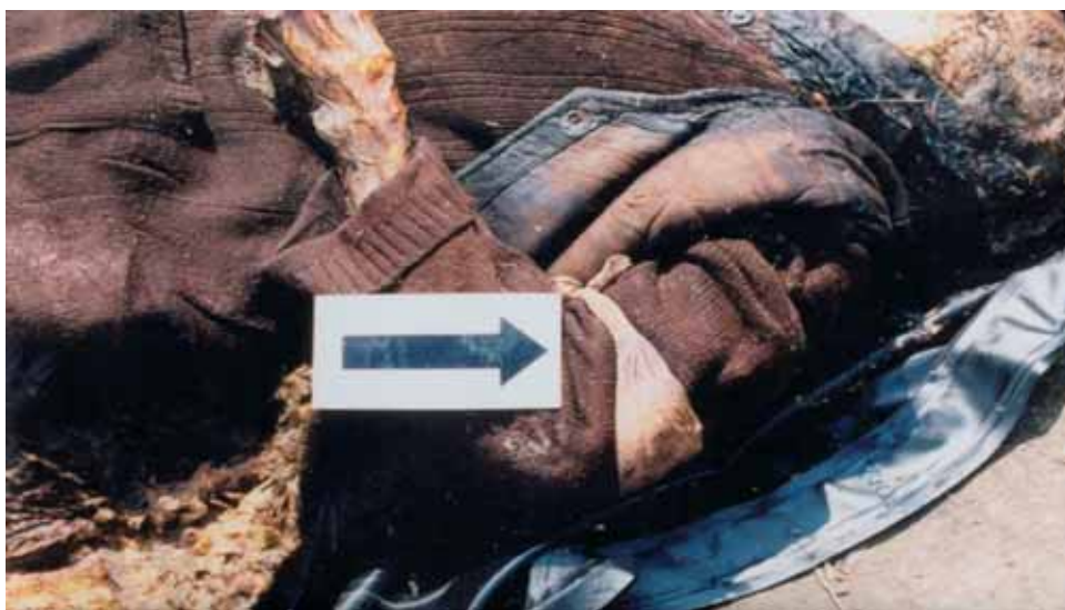
Slika 5. Bijele vrpce na nad- lacticama, nađene na žrtvama u masovnim grobnicama u Lovasu i Tovarniku

identificiranih osoba, 87% žrtava (njih 2.652) čine Hrvati. Kada se govori o nacionalnoj pripadnosti identificiranih žrtava, potrebno je istaknuti da je u pojedinim mjestima u hrvatskom Podunavlju mučkim ubojstvima Hrvata koji su ostali živjeti u svojim domovima prethodilo njihovo obilježavanje (slika 5).