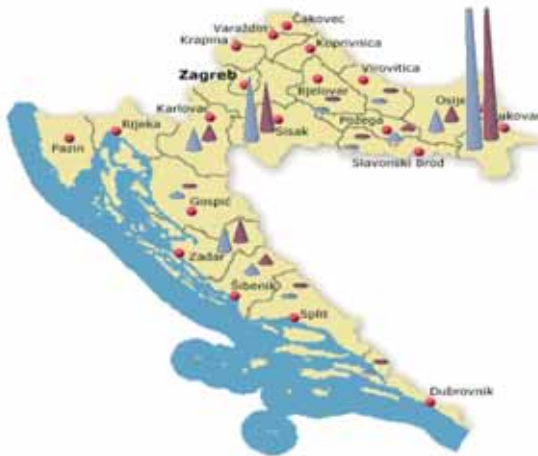
Slika 4. Broj ekshumiranih i identificiranih osoba prema županijama

Prema službenim evidencijama Uprave za zatočene i nestale, do veljače 2008. godine ekshumirani su iz 143 masovne grobnice i više od 1.400 pojedinačnih grobnica posmrtni ostaci 3.605 osoba, od kojih je identificirano njih 86% (odnosno, 3.083) (slika 4).