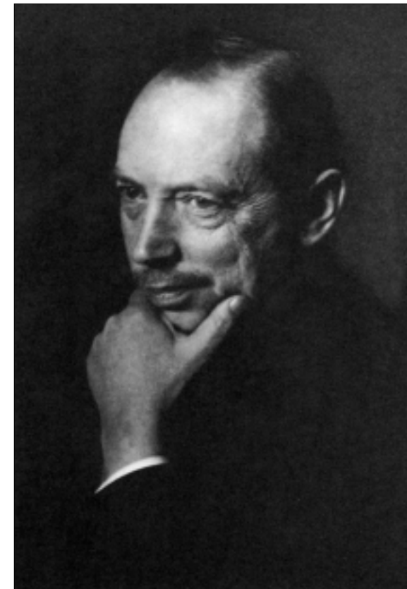
Friedrich Thimme (1868.—1938.)

Njemačka nije bila samo vojnički poražena, nego i politički desetkovana, a psihološki ponižena. U tom svjetlu je i pitanje odgovornosti za svjetski rat (tzv. Kriegsschuldfrage ), napose članak 231. Versailleskoga ugovora, kojim je — nakon naglašenoga francuskog inzistiranja — utvrđena njemačka krivica za njegovo izbijanje, postalo ne samo jedno od ključnih pitanja njemačke vanjske politike, nego i bitan čimbenik unutarnjega društvenog i ideološko-političkog raslojavanja. Njemačka je vlada zbog toga već u srpnju 1919. donijela odluku o pripremanju zbirke dokumenata koja bi rasvijetlila diplomatske i političke aktivnosti uoči Prvoga svjetskog rata. Prvotna vladina nakana, da objavi Bijelu knjigu koja je imala objasniti i opravdati ulogu Njemačkoga Reicha, zaslugom priređivača obuhvatila je ne samo izvorno planirano razdoblje od 1912. naovamo, nego se je protekla sve do vremena osnivanja Reicha, 1871. godine. Slijedom toga pretvorila se u impozantnu zbirku dokumenata o predratnoj politici, koja je pod naslovom Die grosse Politik der Europäischen Kabinette, 1871—1914. Sammlung der diplomatischen Akten des Auswärtigen Amtes im Auftrage des Auswärtigen Amtes (Visoka politika europskih vlada 1871.—1914. Zbirka diplomatskih dokumenata Ministarstva vanjskih poslova, po ovlasti Ministarstva vanjskih poslova) objavljena u Berlinu od 1922. do 1927. u 40 knjiga (od čega je čak dvanaest objavljeno u dva sveska). Zbirku su uredili Johannes Lepsius