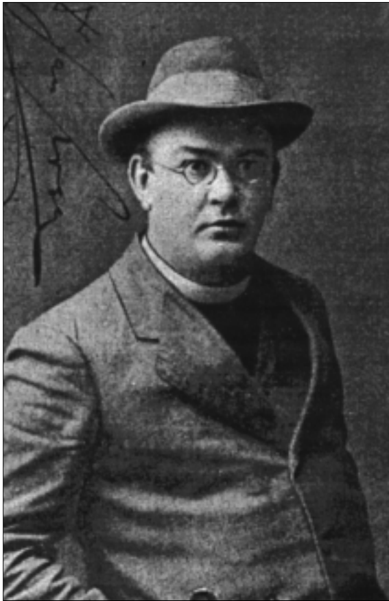
Janez Evangelist Krek (1865.—1917.)

darske zveze», centrale za prodaju i nabavu ratarskih proizvoda. Većinom sve produkcijske seljačke zadruge prodaju produkte svoje i svojih članova s pomoću »Gospodarske zveze«, koja se razvila osobito u vrijeme rata u uzorno uređeno gospodarsko središte za opskrbu Kranjske. Tim, što se »Gospodarska zveza« brinula, da što bolje proda prirod slovenskoga seljaka, podiglo se u Kranjskoj ratarstvo, napose vinogradarstvo i stočarstvo na nevidenu visinu, te se već radilo o tom, da »Gospodarska zveza« preuzme opskrbu ratne mornarice mesom, a to znači mjesečno poslati u Pulu oko tisuću volova. Kranjsko je stočarstvo tako jako, da ga ni rat u susjedstvu nije mogao znatno oštetiti. — Za mljekarstvo se pobrinuo dr. Krek osnovavši za onaj veliki broj mljekarni po selima centralu u Ljubljani pod imenom »Mlekarske zveze«. Što vrijedi kranjsko mljekarstvo, vidi se po tomu, što većina Trščana pije mlijeko iz kranjske Vipave.