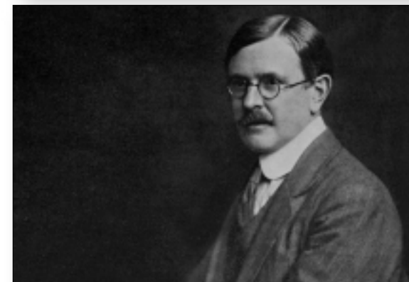
Robert W. Seton-Watson

Osvrćući se na međunarodnu krizu koju je izazvala aneksija Bosne i Hercegovine, Seton-Watson je ustvrdio da je ta nekadašnja otomanska pokrajina došla u »neopozivi posjed kuće Habsburg« te da je »težište južnoslavenskoga pitanja prešlo s Beograda na Zagreb, odnosno od Srba na Hrvate.« 24