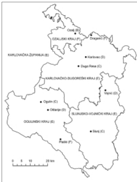
Slika 5. Indeks demografskih resursa urbanih i urbaniziranih naselja te prostornih sastavnica Karlovačke županije u razdoblju 1991.—2001.

Među urbanim i urbaniziranim naseljima Županije najviše vrijednosti promatranog indeksa pokazuje grad Ozalj (tip B — bodovni pokazatelj 133,1) što, sukladno tipologiji (Nejašmić, 2005), govori da je riječ o demografski stabilnom području s razmjerno dobrim demografskim resursima. Ozaljski kraj pokazuje puno lošije stanje (tip F — bodovni pokazatelj 18,8) što znači da se radi o demografski krajnje ugroženom području vrlo slabih demografskih resursa. Dakle, ruralno-urbana polarizacija ozaljskog kraja, promatrana kroz usporedbu indeksa demografskih resursa Ozlja i okolnog ruralnog prostora, izrazito je snažna. Ogulin (bodovni pokazatelj 94,2), Slunj (bodovni pokazatelj 99,0) i Duga Resa (bodovni pokazatelj 80,9) ulaze u kategoriju demografski oslabljenih (regresivnih) područja (tip C), a Karlovac (bo-