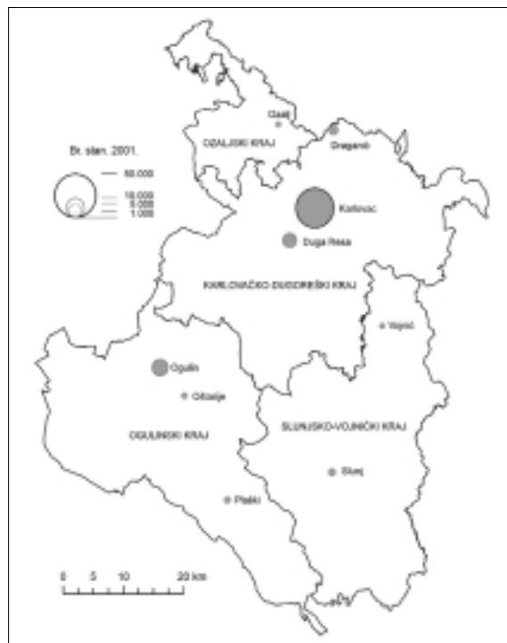
Slika 2. Proučavane prostorne sastavnice te urbana i urbanizirana (prijelazna) naselja Karlovačke županije.