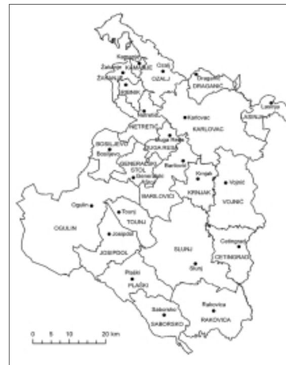
Slika 1. Podjela Karlovačke županije na gradove i općine

gradskih naselja postoje brojni kriteriji. Glavni su kriteriji za izdvajanje gradova koje je definirao H. Bobek (1927.) kompaktnost naselja, veličina naselja (broj stanovnika) i gradski način života stanovništva naselja (Vresk, 2002.). Dobar model izdvajanja gradova osmislio je hrvatski geograf M. Vresk (tablice 1 i 2). Posljednja modificirana verzija njegovog modela izdvajanja, za popis stanovništva 2001., temelji se na broju stanovnika, postotku poljoprivrednog stanovništva u ukupnom stanovništvu te postotku aktivnih mještana koji rade u naselju, ali izvan vlastitog poljoprivrednog gospodarstva. Modelom se izdvajaju dvije skupine naselja: urbana i urbanizirana (Vresk, 2008.).