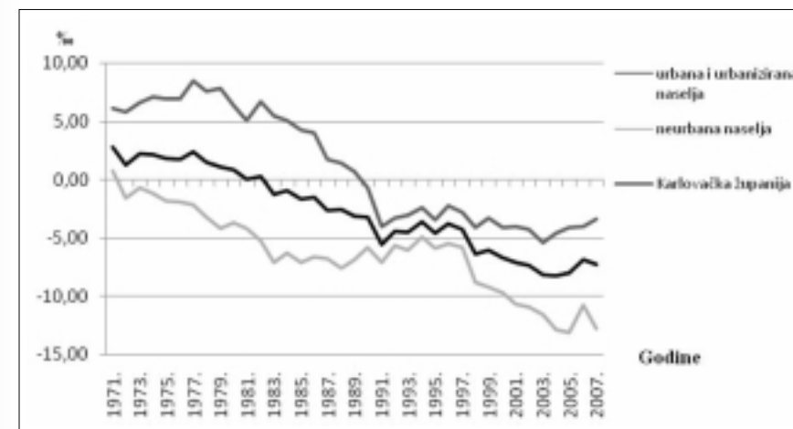
Slika 4. Stope prirodne promjene (u ‰) za urbana (s uključenim urbaniziranim) i neurbana naselja Karlovačke županije (1971.–2007.)