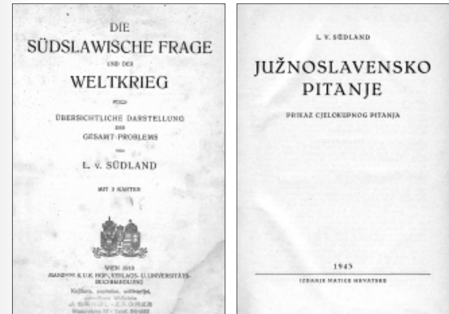
»Bečko« izdanje iz 1918. godine i hrvatski prijevod Ferde Puceka iz 1943.

starijih tekstova, trebalo tiskati u bilješkama ispod osnovnog teksta, nego na kraju svakoga poglavlja (ili na kraju knjige, što valja prepustiti uredničkoj odluci). Tek na taj će način novo izdanje zadovoljiti i visoke kriterije »kritičkog izdanja« (prevažnog za struku) i biti pristupačno širokom krugu zainteresirane kulturne javnosti.