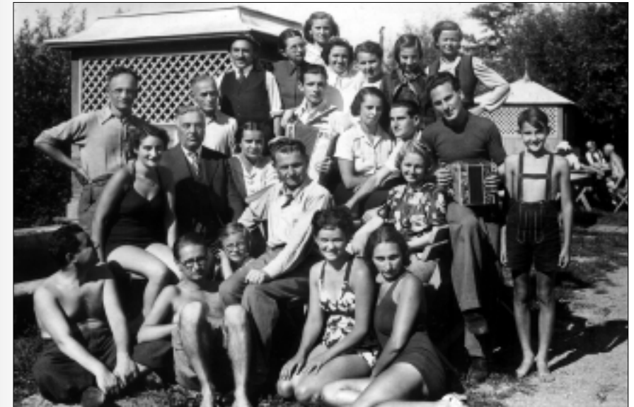
Osim vegetarstvo, članovi društva voljeli su i sunce i plivanje. Slika sa kupališta na Savi

nastojanja nisu urodila nikakvim rezultatom, tako da je prvo vegetarijansko društvo u Hrvatskoj ono društvo u čijem je radu sudjelovao i dr. Ivo Pilar, a koje je osnovano 1928. pod imenom Vegetarsko društvo. 10