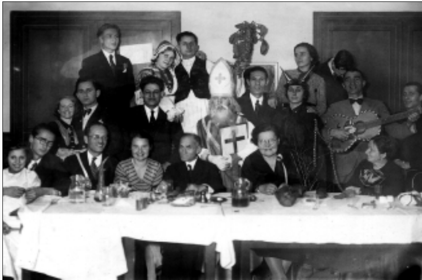
Proslava Nikolinja u Vegetarskom društvu

devit Franković, 6 kako bi ishodio odobrenje za početak rada društva. U molbi se ističe da se u državi, a napose u Zagrebu, povećao broj vegetarijanaca te se traži: »da se oni organiziraju, kao što su organizirani u svim velikim kulturnim državama zapada«. 7