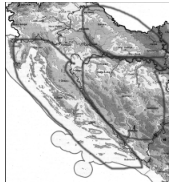
Karta 1 — Geopolitičke cjeline hrvatskog teritorija

nas Hrvati kao pretežni ili barem znatni dio pučanstva. Prema ovoj definiciji spadaju u hrvatske zemlje Hrvatska, Slavonija, Dalmacija, Bosna, Hercegovina i Istra. 16